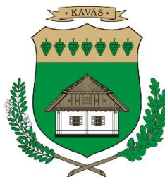
Kávás Község Önkormányzata