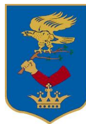
Zalacséb Község Önkormányzata