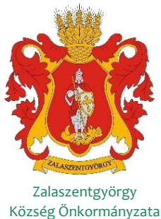
Zalaszentgyörgy Község Önkormányzata