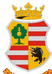
Zalaboldogfa Község Önkormányzata